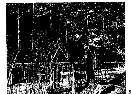
①芝生のスプリンクラーで水遊び